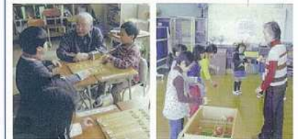
上の写真はおはじき、左は将棋、右はけん玉です。