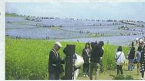
写真は、ひたち海浜公園。

5月8日(木) 恒例の美しが丘社協主催のバス旅行が行われました。今回は、13回目です。