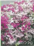
美しが丘公園のつつじ

美しが丘地区社会福祉協議会は、美しが丘1、2、3丁目の各団体の代表および個人が参加して組織構成され、社会福祉活動を進めていく任意団体です。地域の皆さんが安全に安心して暮らせる街づくりを、福祉の面で支えたいと思っています。